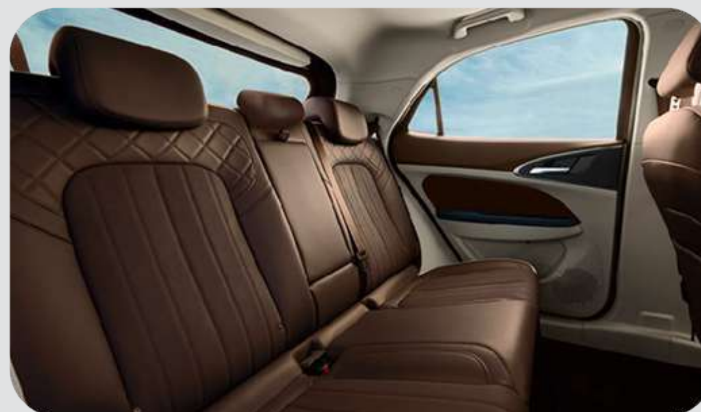
Café / Blanco