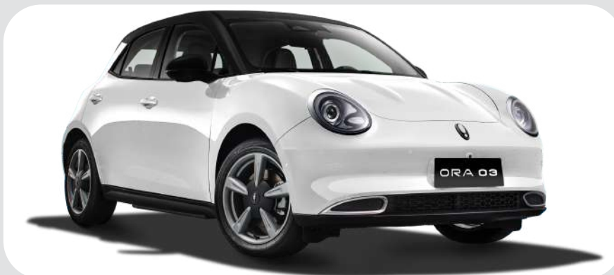
Snow White /Midnight Black